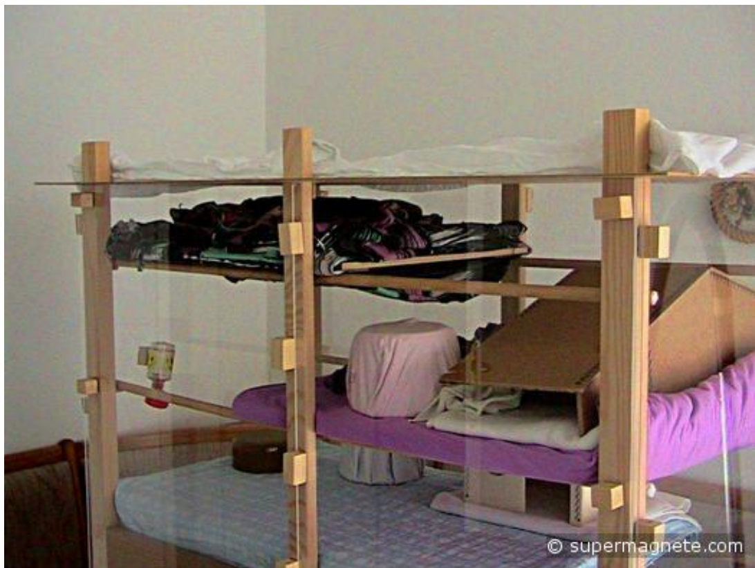
Vakantiewoning met inrichting