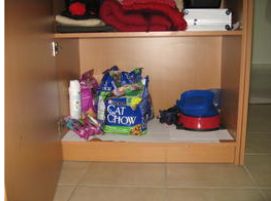
Een geheel normale kast - denkt men in ieder geval

In Mexico zijn de mensen licht wantrouwend, wat vreemdelingen in huis (huishoudsters, werklui, babysitters etc.) betreft. Daarom moet men nieuwe methodes uitdenken, om sieraden en contant geld veilig te verbergen.