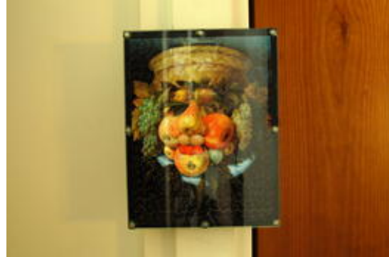
Is dit nou een gezicht...

De puzzel is van PMW ( www.pmw.fr ) en werd voor de speciale tentoonstelling 'Arcimboldo' in het Musée du Luxembourg in Parijs geproduceerd.