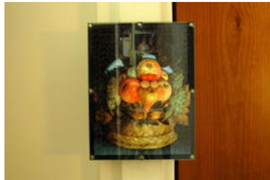
... of een fruitmand?

Ik wilde de puzzel weliswaar goed inlijsten, maar tegelijkertijd de lijst ook weer snel weg kunnen halen, om de puzzel meermaals te kunnen leggen. Bovendien wilde ik het geheel, ingeraamd en opgehangen, met een eenvoudige handbeweging kunnen omkeren.