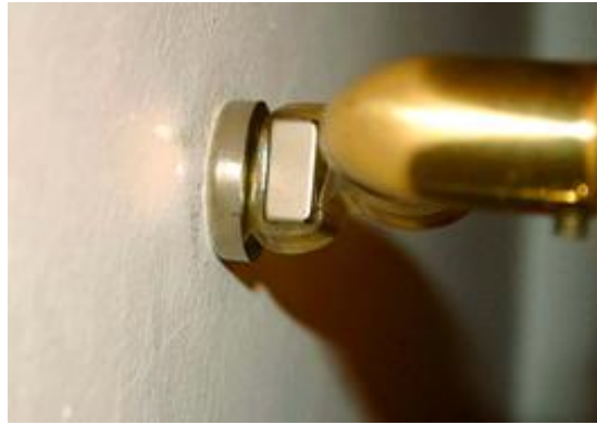
Deze deur blijft open!

geprobeerd, maar deze was voor ons geval te sterk. Indien een deur echter aan werkelijk zware windstoten is blootgesteld, zou men die ook kunnen proberen.