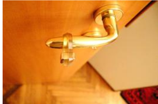
Blokmagneet Q-20-20-10 in het bufferdeel geschoven

Bevestigt u de buffer zodanig op de klink, dat u hem nog gemakkelijk kunt gebruiken en schuift u nu in de tweede lus van de buffer uw blokmagneet ( www.supermagnete.de/dut/Q-20-20-10-N ). Zo is hij mooi gefixeerd, kan nauwelijks verschuiven en zal daardoor niet uit de lus kunnen glijden.