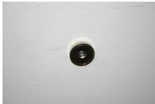
Ringmagneet in stalen pot: CSN-32

Neemt U een boormachine en pluggen en schroeven in de juiste afmetingen. Ik heb een plug van 5 mm doorsnede gebruikt, die voor elke relatief stevige wand zou moeten volstaan. Voor minder stevige wanden adviseer ik een langere plug te gebruiken.