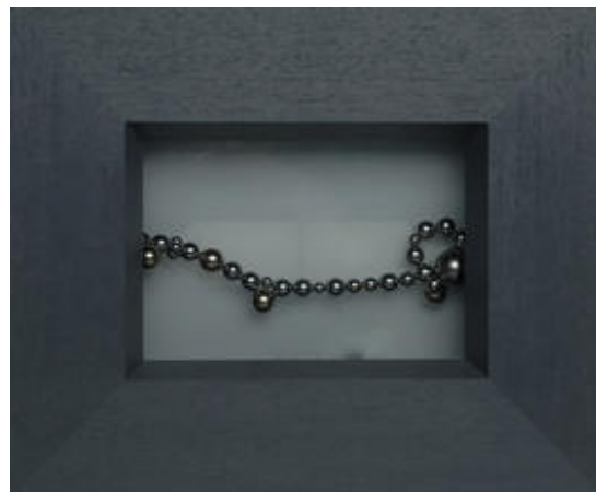
Kunst by zinnkraut: 'Perlen im Licht', kogelmagneten voor melkglas, tweevoudig belicht, 28x25 cm, Zürich 2005

Uit enthousiasme over de supermagneten heb ik toen een eigen kunstwerk gecreëerd, waarbij de kogelmagneten in het middelpunt staan. Links en rechts in de omraming heb ik onzichtbaar achter hout twee grote magneten ingelijmd en daartussen heb ik de kogelmagneten als een soort kralenketting 'geregen'.