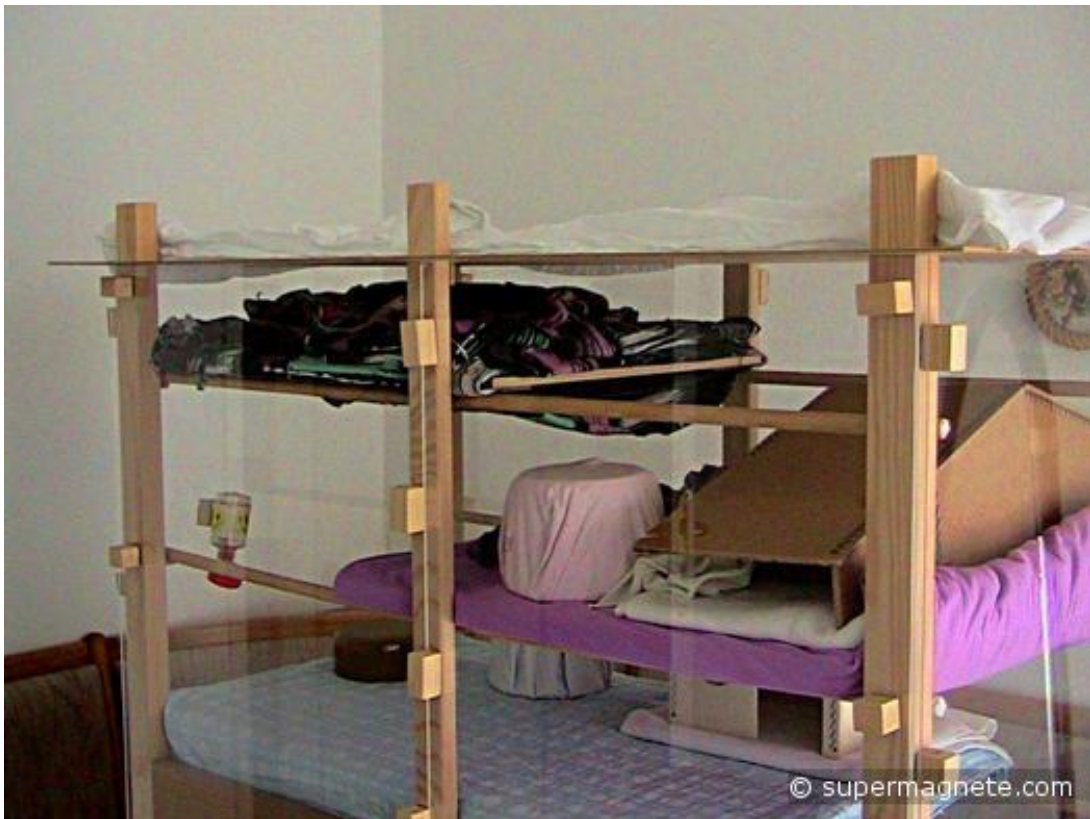
Maison de vacances équipée