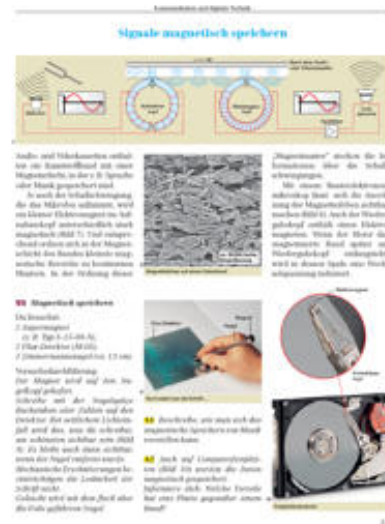
fichier PDF, 190 kB