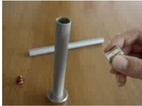
Vidéo, 1 MB

Lorsque les aimants s'approchent à une certaine distance de l'anneau, ils sont soudain fortement attirés et accélèrent en direction de l'orifice de l'anneau. La bille placée devant est alors propulsée avec une certaine force. Le film montre à quel point cela fonctionne bien !