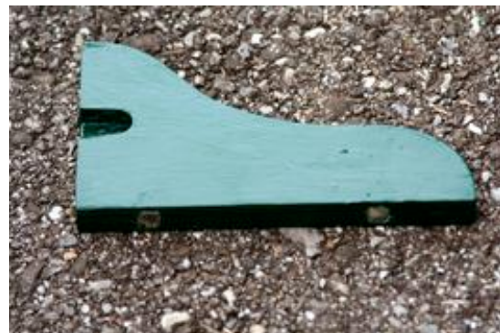
Support du rouleau de papier, avec de petits cubes magnétiques collés sur le devant