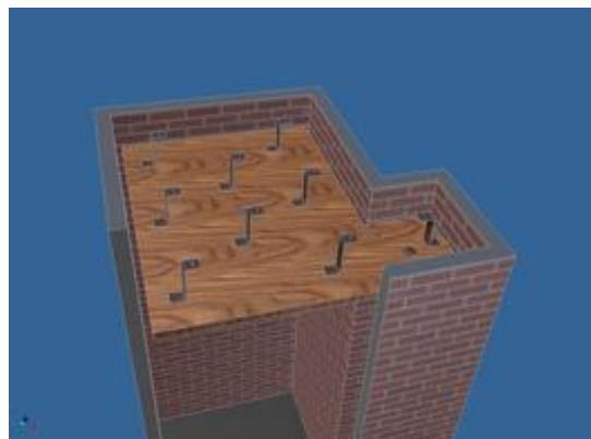
Vue du dessus et de biais

Grâce aux nombreux aimants, il tient parfaitement sur les poutres.