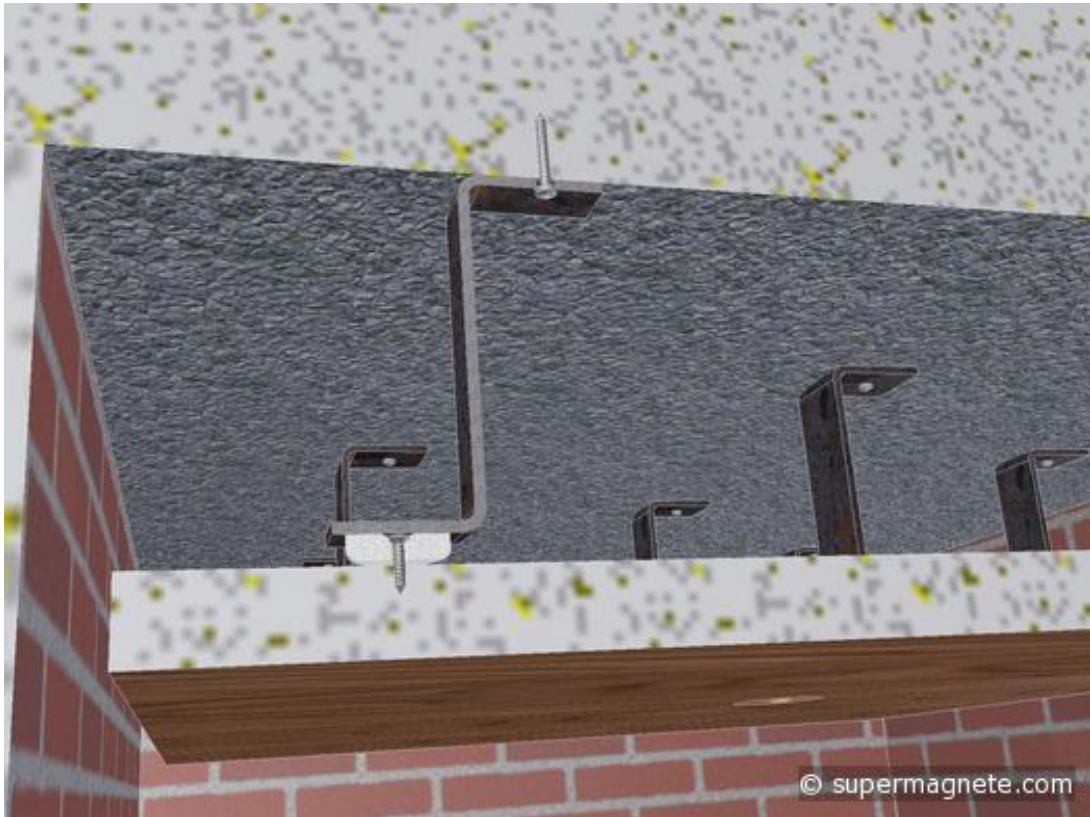
Cette image numérique montre les emplacements des vis

Puis, il a vissé à neuf endroits un aimant en pot avec trou de fixation biseauté ( www.supermagnete.de/fre/CSN-25 ) de 25 mm de diamètre au panneau, il a fixé les anneaux magnétiques de façon à ce que leur position corresponde à celle des poutres en acier fixées au plafond (voir image).