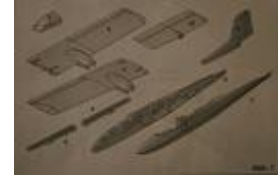
fichier PDF, 650 kB

Si vous comprenez mieux l'espagnol que moi, je vous invite à consulter ce document PDF qui contient beaucoup d'informations complémentaires (disponible uniquement en espagnol).