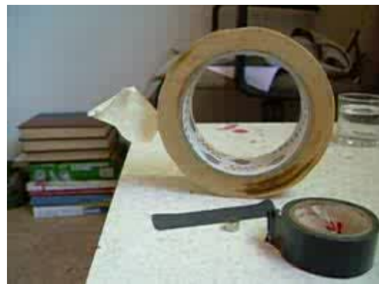
Vidéo, 4.1 MB

Ici vous voyez en détail comment j'ai procédé pour fixer les aimants. Dans cette version, on ne les voit pas. Peut-être vous préférez cette méthode, car d'éventuels spectateurs seront encore plus impressionnés s'ils ne comprennent pas tout de suite le principe de l'expérience.