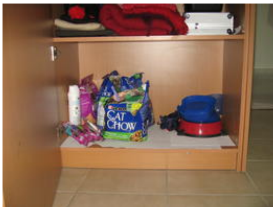
Un normalissimo scaffale: è quello che si potrebbe pensare

In Messico le persone sono un po' diffidenti verso gli estranei che entrano in casa (governanti, artigiani, babysitter, etc...). Pertanto devono pensare a posti sempre nuovi in cui nascondere gioielli e contanti in modo sicuro.