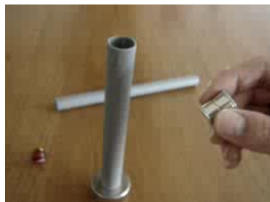
Vídeo, 1 MB

Cuando el paquete de imanes se acerca lo suficiente al anillo, de repente es fuertemente atraído y acelerado por la apertura del anillo. La canica resulta disparada con bastante fuerza. El vídeo muestra el funcionamiento.