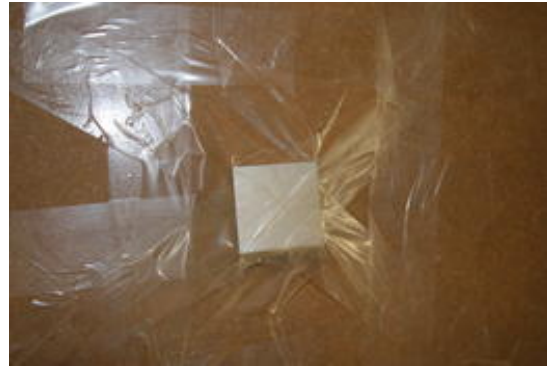
La mesa por debajo

Adhiera el imán de la muerte por la parte inferior de la mesa. No ahorre en cinta adhesiva, al fin y al cabo no queremos que el imán se desprenda en mitad de la actuación.