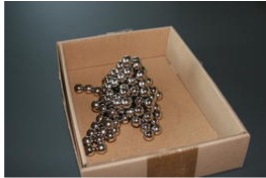
Un montón de esferas "imposible"

Da igual cuántas veces lo intente la víctima - parecerá estar embrujado y no funcionará. Y cuando usted lo hace parece tan sencillo.