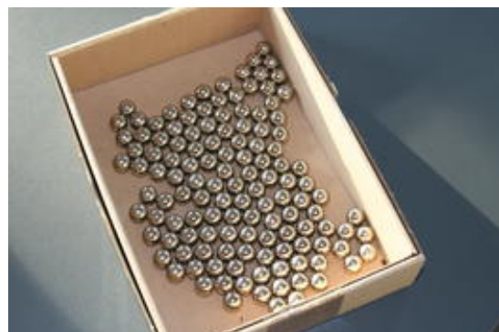
Esferas de acero en una cajita