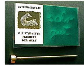
Fluxdetector als opslagmedium

En veel dataexperten beweren zelfs, dat de levensduur van datatapes en harde schijven diejenige van zelfgebrande CD's en DVD's duidelijk zal overtreffen.