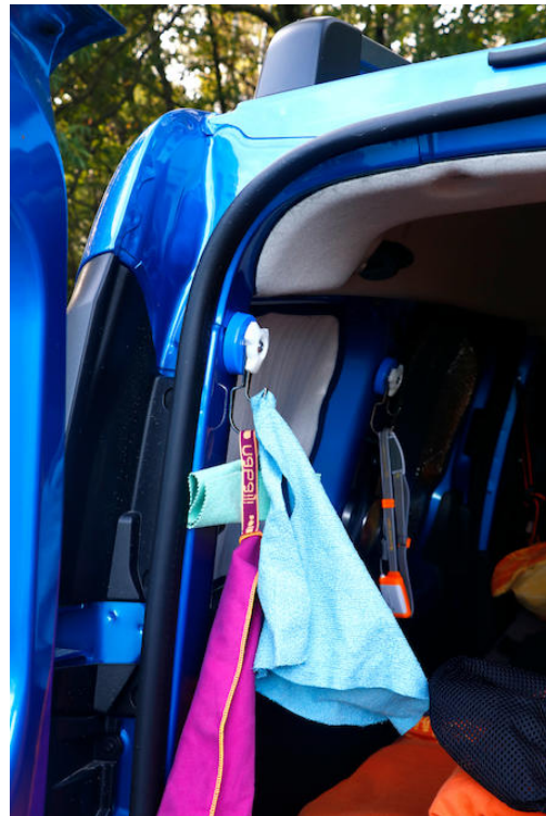
Van magneethaak tot handdoekhouder

Echt praktisch zijn de dubbelhaakmagneten ( www.supermagnete.de/dut/M-90 ) als handdoekhouder in de camper. Met de magneethaak kan men gewoon bliksemsnel een vaste plek voor je handdoeken creëren, zonder dat men in de geliefde bus of de ingebouwde meubelen hoeft te boren. Juist wanneer men zo weinig plek heeft is het super, wanneer dingen zoals handdoeken gewoon hun vaste plekje hebben. Dat zorgt aan de ene kant voor meer orde en aan de andere kant zijn de handdoeken bij behoefte supersnel klaar voor het grijpen. Ook praktisch: De handdoeken kunnen aan de haken ook meteen weer goed opdrogen.