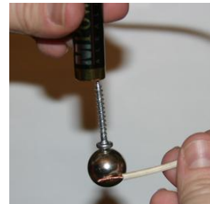
Bille magnétique K-19-C ( www.supermagnete.de/fre/K-19-C )

Le plus facile est de choisir un disque magnétique d'au moins 8 mm de diamètre et d'au minimum 3 mm d'épaisseur. Mais il est clairement plus rigolo avec les aimants plus gros. Si vous avez déjà un disque magnétique en néodyme, essayez-le donc sans tarder ! L'expérience fonctionne même avec des cylindres ou des boules magnétiques.