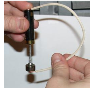
Disque magnétique S-15-08-N ( www.supermagnete.de/fre/S-15-08-N )

L'expérience a été décrite dans le journal Physik in unserer Zeit (physique de notre temps). Cette expérience nous a, ici chez supermagnete.de, complètement stupéfiés. Nous sommes déjà depuis longtemps fascinés par nos aimants, mais quand nous avons vu qu'on peut faire avec un aimant et trois petits éléments supplémentaires un moteur électrique (moteur homopolaire), nous le sommes encore plus ! En cinq minutes, nous avons construit notre petit moteur et nous ne nous lassions plus de voir tourner l'aimant. Un phénomène incroyable !