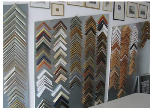
Toute la collection des échantillons de coins de cadres en un coup d'œil

Tout d'abord, j'ai installé une plaque de fer zinguée d'une épaisseur d'1 mm sur le mur. Une alternative aurait été de couvrir le mur avec de la peinture magnétique ( www.supermagnete.de/fre/group/magnetic_paint ).