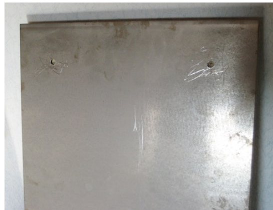
Le dos de la plaque

La photo montre le principe de la fixation avec un petit morceau de fer. En réalité, j'ai bien sûr percé et fraisé la grande plaque en acier.