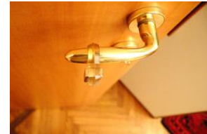
Parallelepipedo magnetico Q-20-20-10 inserito nel respingente

Sono necessari soltanto 2 dei vostri straordinari magneti: un Q-20-20-10-N ( www.supermagnete.de/ita/Q-20-20-10-N ) e un magnete con base in acciaio CSN-32 ( www.supermagnete.de/ita/CSN-32 ).