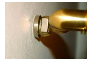
Questa porta resta aperta

Da questo momento in poi potete aprire comodamente la vostra porta e anche senza un ulteriore fermaporte è quasi impossibile che si richiuda da sola, a meno che non arrivi un tornado :-)