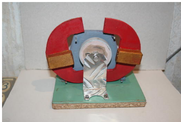
Die Kiefer kippen auseinander, weil die Magnete auf der Scheibe weggedreht werden