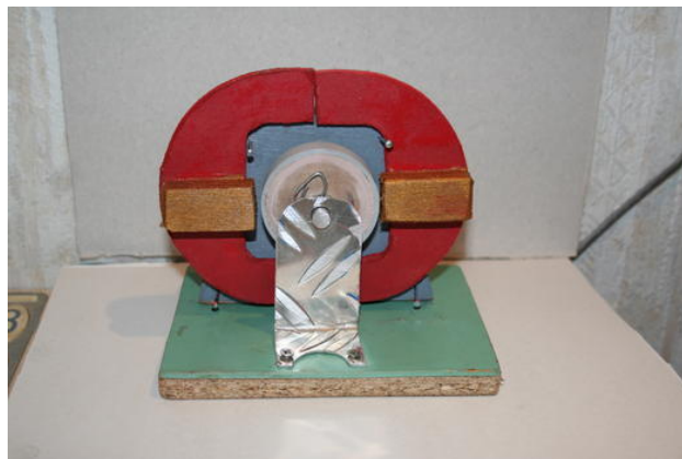
Die Magnete am Rand werden angezogen - die Kiefer schliessen sich