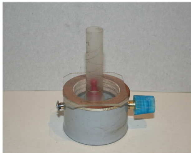
Jetzt wird der Spielfigur magnet angezogen...

Achtung: Die zwei Magnete sollen niemals direkt aufeinander prallen, da sie sonst schnell kaputt gehen. Deshalb habe ich den Zylinder unten mit Plexiglas abgeschlossen.