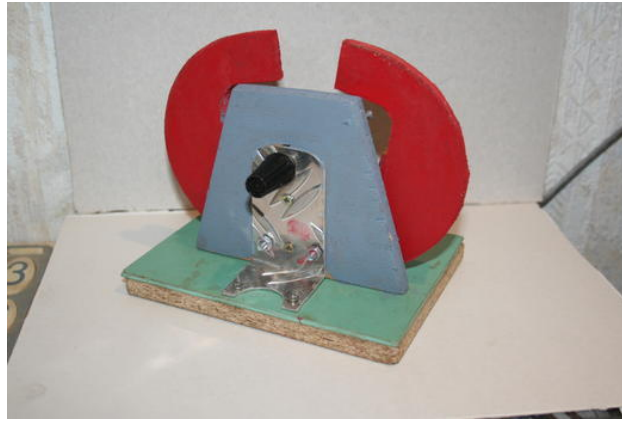
Auch hier wird die Scheibe von Hand über eine Welle gedreht