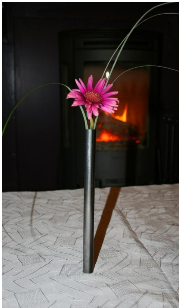
Die Vase scheint von selbst stabil auf dem Tisch zu stehen.