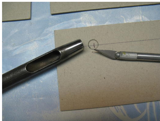
Locheisen zur Anfertigung einer Vertiefung in die Pappe