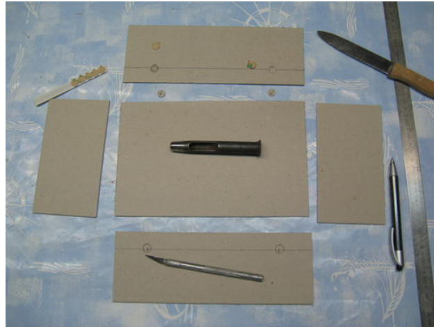
Kastenbestandteile aus Pappe

Das gleiche Prinzip wie oben beschrieben kann auch genutzt werden, um einen Kasten aus Pappe magnetisch zu präparieren. Ich habe die selbstklebenden Scheiben in die Längsseite des selbst zugeschnittenen Kastens eingelassen (siehe Fotos unten) und den Kasten mit buntem Papier beklebt. Durch das vertiefte Einlegen der Magnete werden diese unter dem farbigen Bezug unsichtbar.