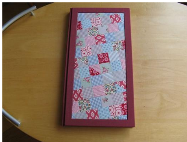
Das Gästebuch mit dem jeweiligen Deckblatt (hier für den Patchwork-Kurs)

So lässt sich das Gästebuchs optisch an jeden Spezialkurs anpassen.