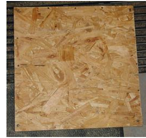
Deckel mit Eisenschrauben

Ich habe in die Unterseite des Deckels 16 Eisenschrauben an den gleichen Stellen wie die Magnete geschraubt. Durch den Kontakt zwischen Magneten und Schrauben liegt der Deckel satt auf der Kiste und fällt nicht ab, auch wenn die Kiste gekippt wird. Ein unbeabsichtigtes Öffnen wird so verunmöglicht.