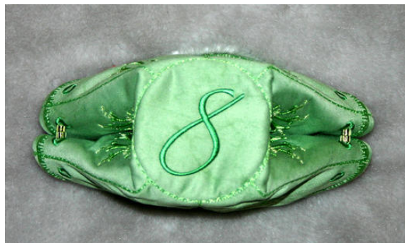
Ansicht von unten