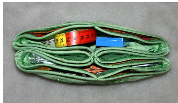
Blick in die Tasche