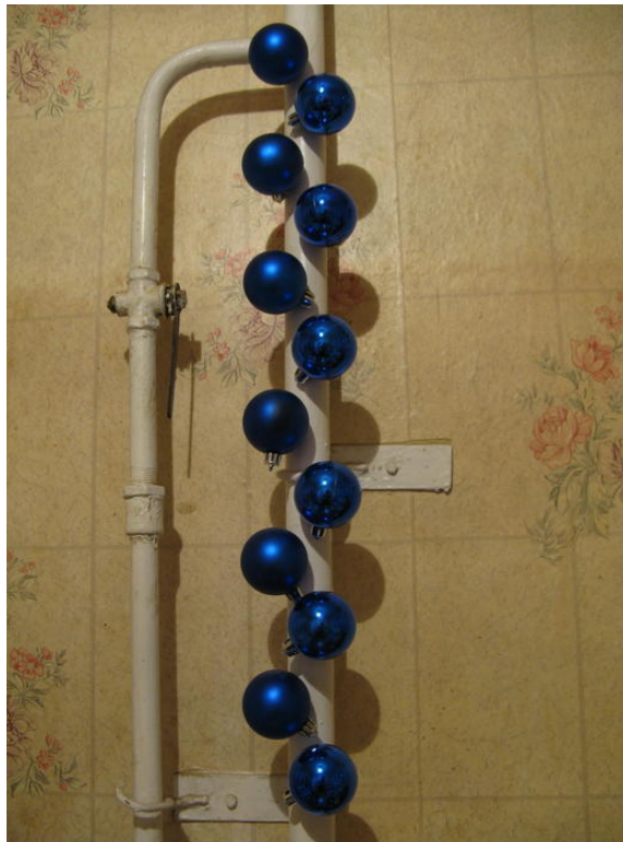
Con las bolas se puede decorar, p. ej., las horribles tuberías del cuarto de baño.