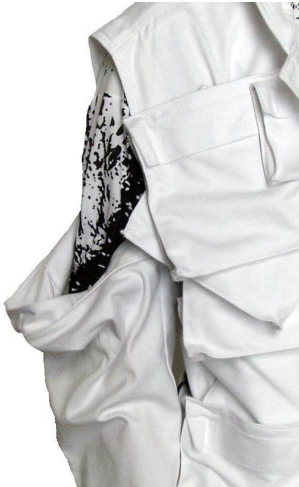
Imagen detallada de una manga de quita y pon