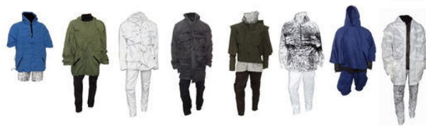
La colección al completo (8 conjuntos) en un vistazo

Toda mi colección está influida por el magnetismo: en casi todos los conjuntos se emplean partes de quita y pon y cierres magnéticos.