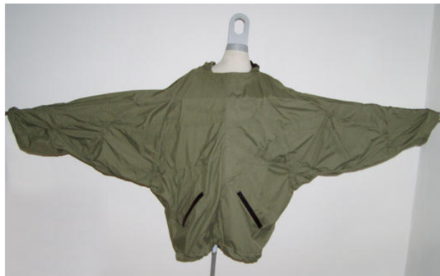
La chaqueta al completo