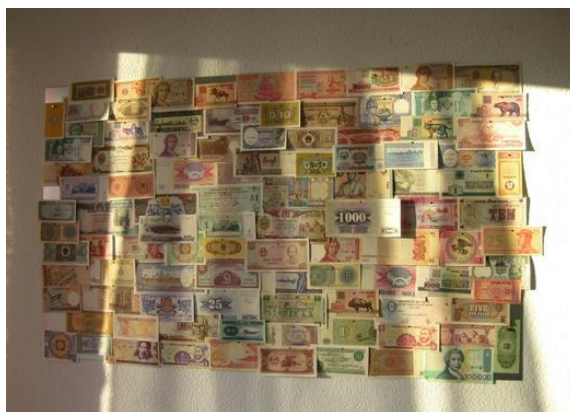
Fijación en horizontal con billetes