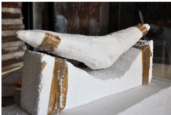
La obra aún sin la capa de yeso; los imanes están fijados con cinta adhesiva.

En uno de los extremos de la obra hay una plancha de plexiglás que limita la libertad de movimiento y estabiliza la levitación.