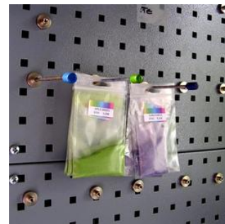
Bolsitas de plástico colgadas

En la rosca atornillamos vástagos roscados M4. Después, dotamos los vástagos para los artículos pequeños de un color específico.