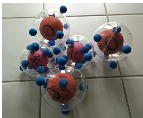
Alumine Al 2 O 3