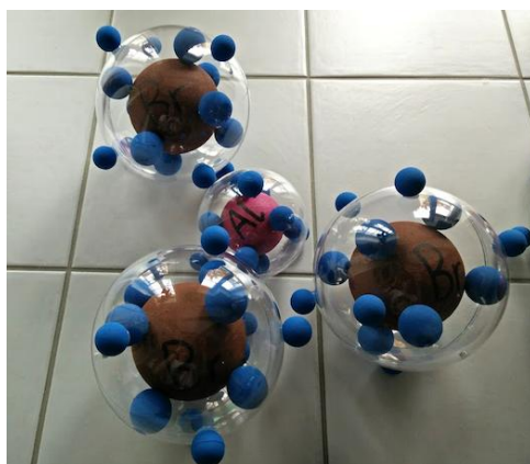
Bromure d'aluminium \text{AlBr}_3