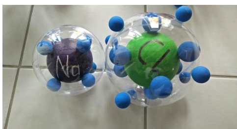
Chlorure de sodium NaCl, face avant

Mon modèle a été réalisé à des fins éducatives. Le but était d'illustrer pour des élèves de 8e et 9e années le passage des électrons lors de la formation de sel. Principe : Des électrons (représentés par des boules en polystyrène) adhèrent magnétiquement aux cœurs des atomes (boules en plexiglas, qui contiennent les composants des atomes). Lorsque deux atomes se touchent, les électrons changent d'atome, d'où l'utilisation d'aimants de différentes puissances.